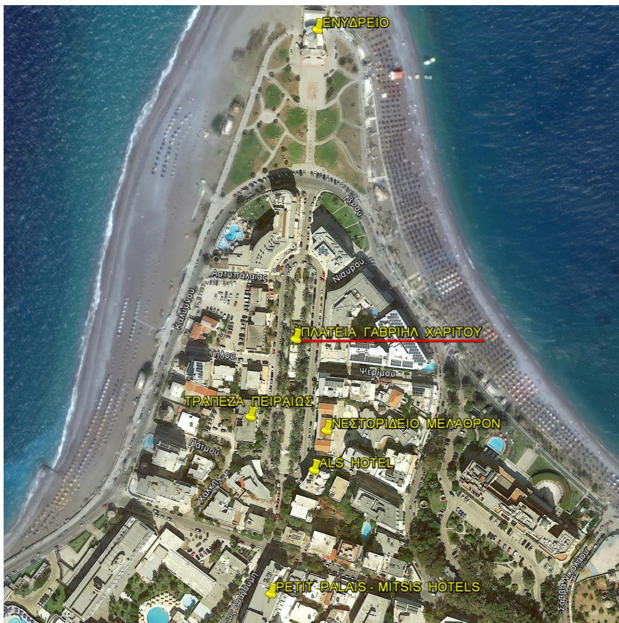
Εικόνα από Google Earth. Θέση Πλατείας και γειτονικά κτίρια.