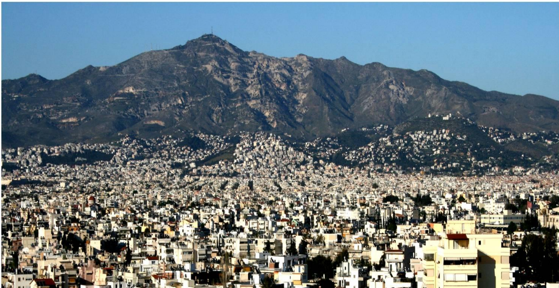
Πεντελικό Τοπίο, φυσικό και ανθρωπογενές περιβάλλον σε αλληλοεξάρτηση.

Ημερίδα «Οικολόγων Πράσινων» : «Η πολιτισμική διάσταση του Τοπίου» . Τεχνόπολις Δήμου Αθηναίων, Γκάζι, 3 Μαΐου 2011.